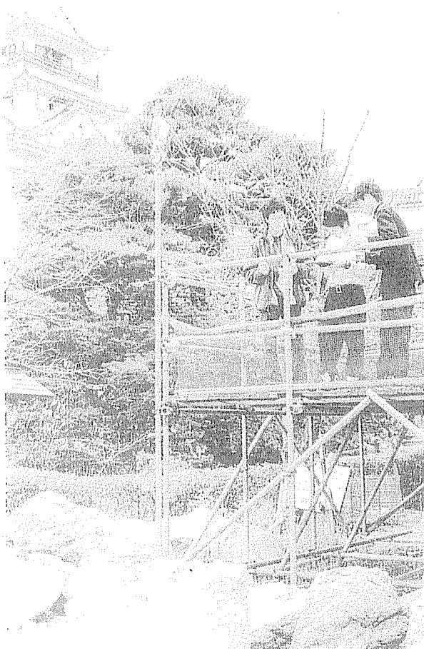
高知城の石垣の構造などを見学する学生ら